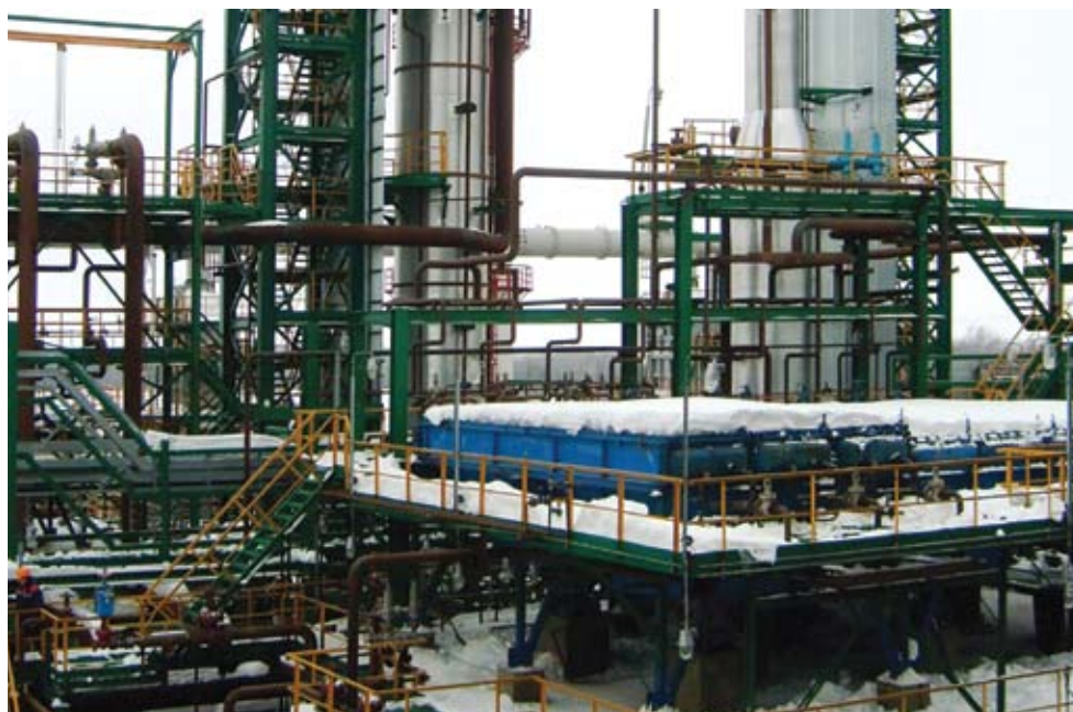
Фото слева: установка «Изомалк-2» в ОАО «Славнефть-Ярославнефтеоргсинтез»

Сравнительные показатели технологии «Изомалк-2» и технологии на базе хлорированных катализаторов изомеризации представлены в таблице 1.